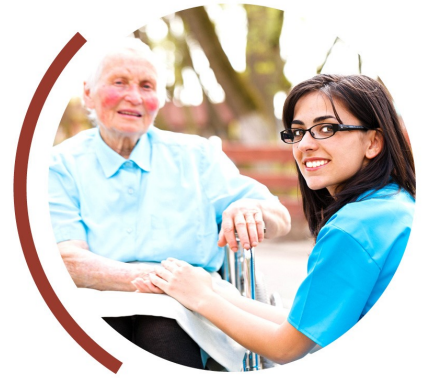
Protection des personnes et des biens Service de Tutelles et de Curatelles (ADPP)